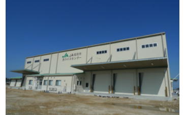
西ライスセンター