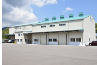
早良ライスセンター